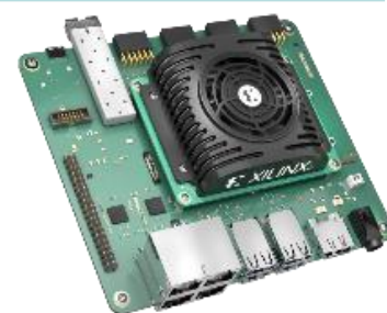
Kria KR260 Kria K26 SoM搭載

本デモ開発を短期間で行うために、既存モデルの「Kria K26 SOM」搭載の「KR 260 スターターキット」(右写真)で先行開発を実施しました。互換性があることも確認できましたので、お客様の選択肢として提案できます。